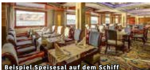
Beispiel Speisesaal auf dem Schiff