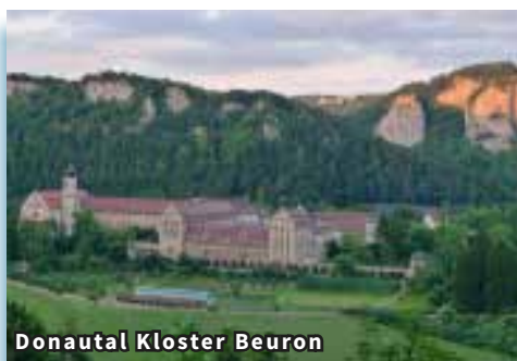
Donautal Kloster Beuron