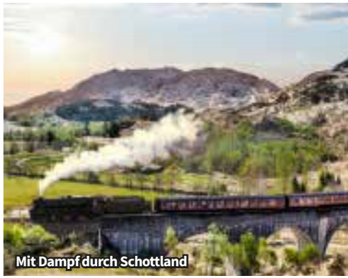
Mit Dampf durch Schottland