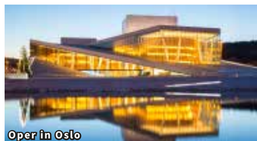
Oper in Oslo

See ins grüne Hallingdal. Nach dem Ferienort Geilo beginnt die Straße ins Hochgebirge der eindrucksvollen Hardangervidda – Europas grösster Hochebene. Beim Fossli Hotel geniessen Sie einen fantastischen Blick auf den berühmten Wasserfall Vøringsfossen. Hier stürzt das Wasser über 185 m frei in die Tiefe und fliesst weiter durch das enge und wilde Tal Mabødal. Auch die Straße windet sich durch dieses enge Tal zurück auf Meereshöhe. In Eidfjord machen wir erste Bekanntschaft mit der spektakulären Natur des Hardangerfjords und überqueren die längste Hängebrücke Norwegens. Welch gigantisches Bauwerk! Tagesziel ist Lofthus. Hier wohnen wir zwei Nächte im sehr schönen und direkt am Fjord gelegenen Hotel Ullensvang.