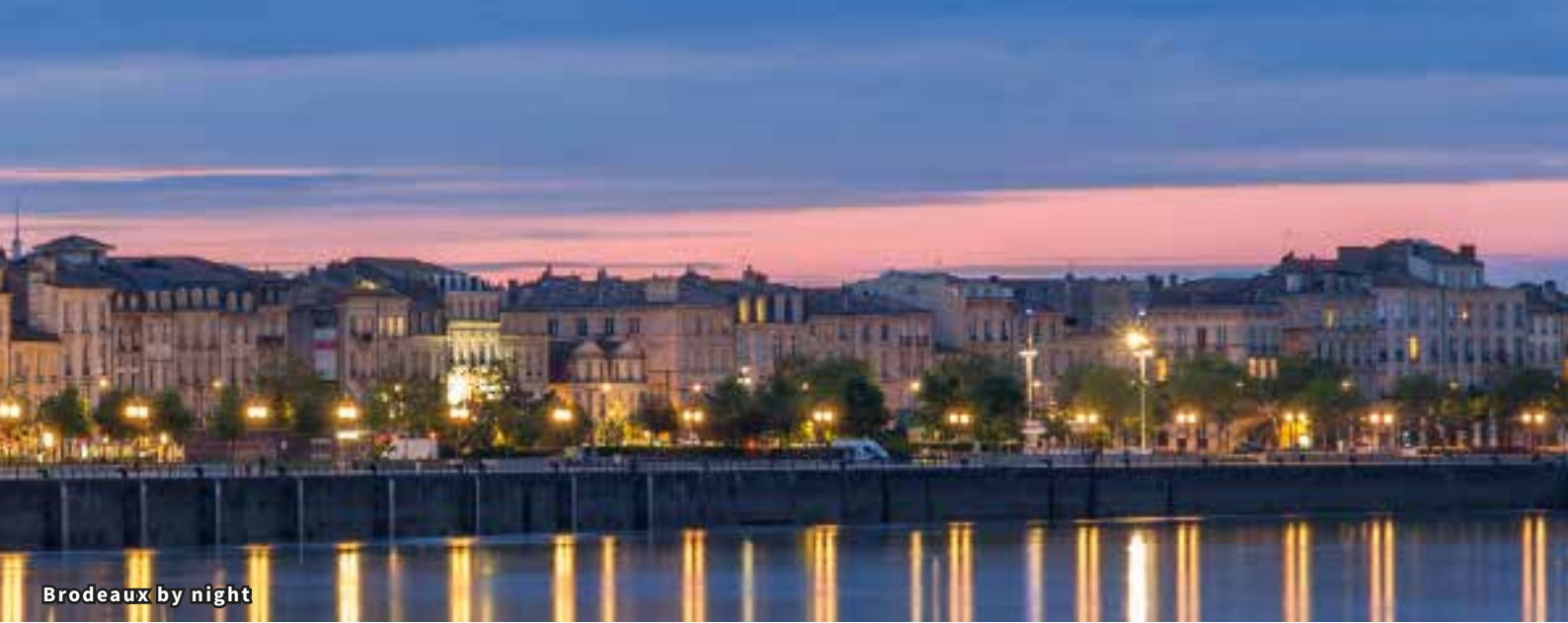
Bordeaux by night