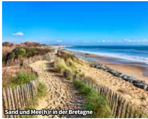
Sand und Mee(h)r in der Bretagne