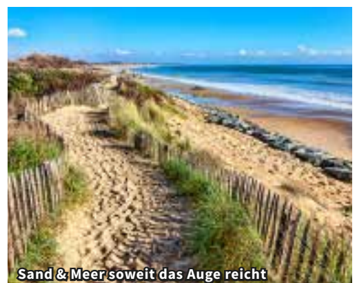
Sand & Meer soweit das Auge reicht

ten Sehenswürdigkeiten der Bretagne. Wie ein gewaltiges Kreuz ragt die Halbinsel von Crozon weit ins Meer hinein. Pittoreske Steilküsten, die bis zu 70 Meter ins Meer hinunterfallen und einige schöne Strände machen Crozon zu einer echten Perle der Bretagne. Man sagt: «Ein Streifzug durch die Presqu'île de Crozon ist wie eine Reise zum «Ende der Welt». Hier trifft man zugleich auf ein sanftes wie raues Universum. Unser Guide zeigt uns das eindrückliche Naturerlebnis von seiner ausserordentlichsten Seite und führt uns zu Aussichtspunkten mit einmaligen Ausblicken. Das Iroise Meer zählt zu den gefährlichsten Gewässern der Welt. Wie treue Gefährten und stille Wächter stehen hier die Leuchttürme und helfen den Schiffen bis heute beim Navigieren in der rauen See. Die Kraft der Gezeiten bewegen hier riesige Wassermassen. Immer noch zerschellen Schiffe an den Klippen. Der Parc Naturel Marin d'Iroise ist zudem die Heimat von Robben und Delphinen. Zu jeder Jahreszeit zeigt sich die Insel in einem anderen Licht, aber immer schenkt sie dem Besucher ein herrliches Naturerlebnis, das Respekt einflösst und verzaubert.