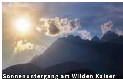
Sonnenuntergang am Wilden Kaiser