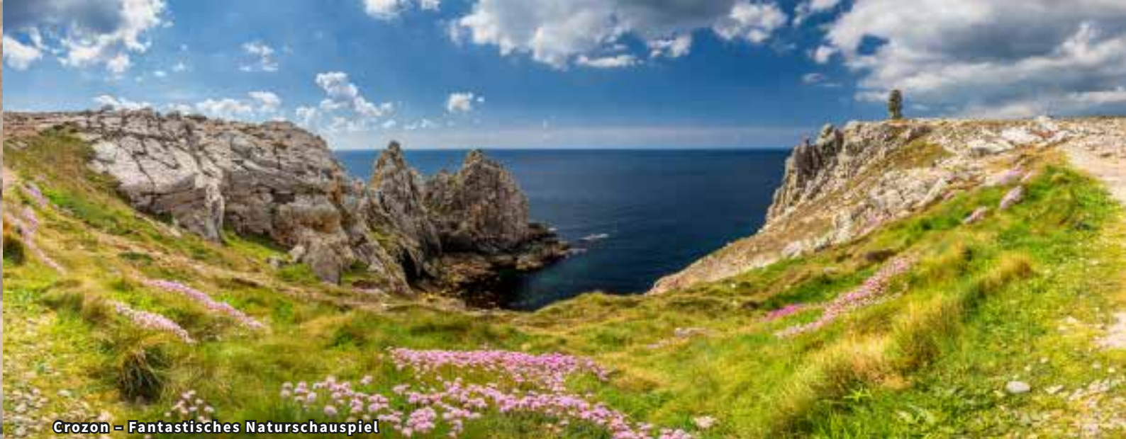
Crozon – Fantastisches Naturschauspiel