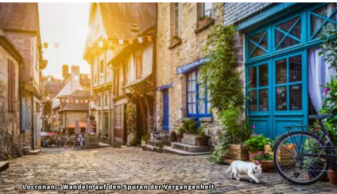
Locronan – Wandeln auf den Spuren der Vergangenheit