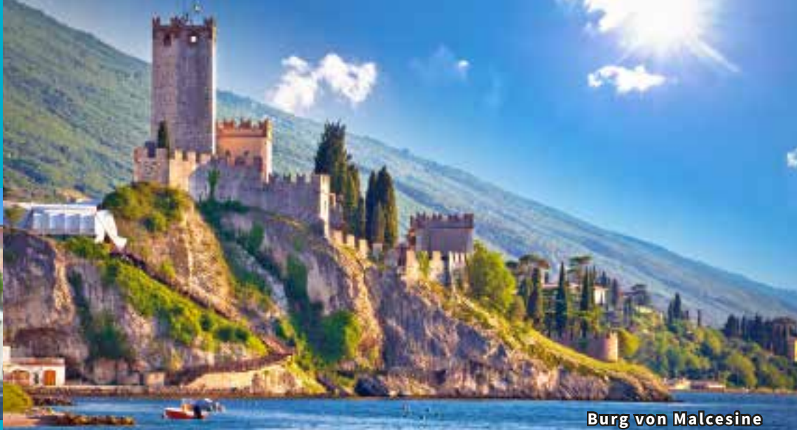
Burg von Malcesine