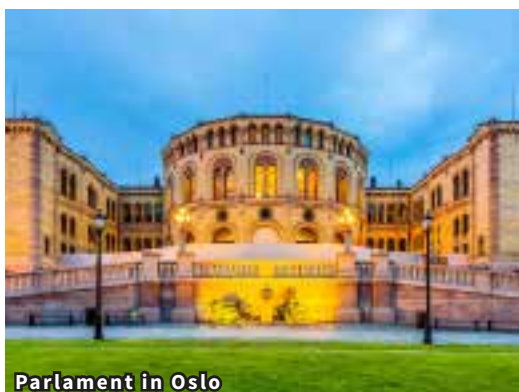
Parlament in Oslo