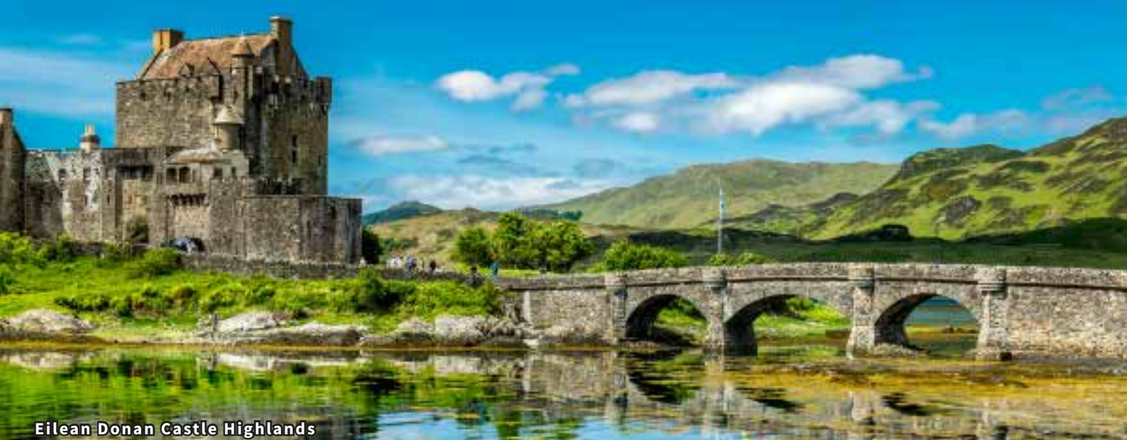
Eilean Donan Castle Highlands