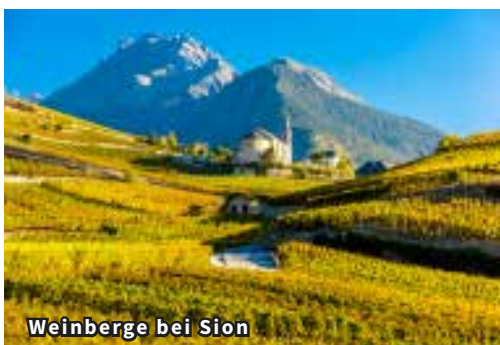
Weinberge bei Sion

Nach dem Frühstück fahren wir durch eines der schönsten Täler der Schweiz, dem Mattertal hinauf nach Täsch. Hier besteigen wir die Zahnradbahn zum Weltkurort Zermatt. Der autofreie idyllische Bergort begeistert Besucher aus aller Welt. Freier Aufenthalt und Option mit der Gornergratbahn auf den Gornergrat zu fahren. Von hier aus geniesst man einen grandiosen Ausblick zum Matterhorn, Gornergletscher, Breithorn und Monte Rosa. Auf der Rückreise nach Brig besuchen wir noch Visperterminen mit dem höchstgelegenen Weinberg Europas. Hier kehren wir zu einem feinen Weisswein Apéro ein und geniessen die goldenen Tropfen aus dem Wallis. Rückkehr ins Hotel zum feinen Nachtessen aus der Hotelküche.