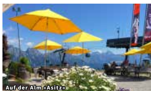
Auf der Alm «Asitz»

Nach dem Frühstück Heimreise in die Schweiz.