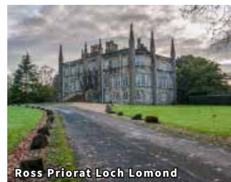
Ross Priorat Loch Lomond