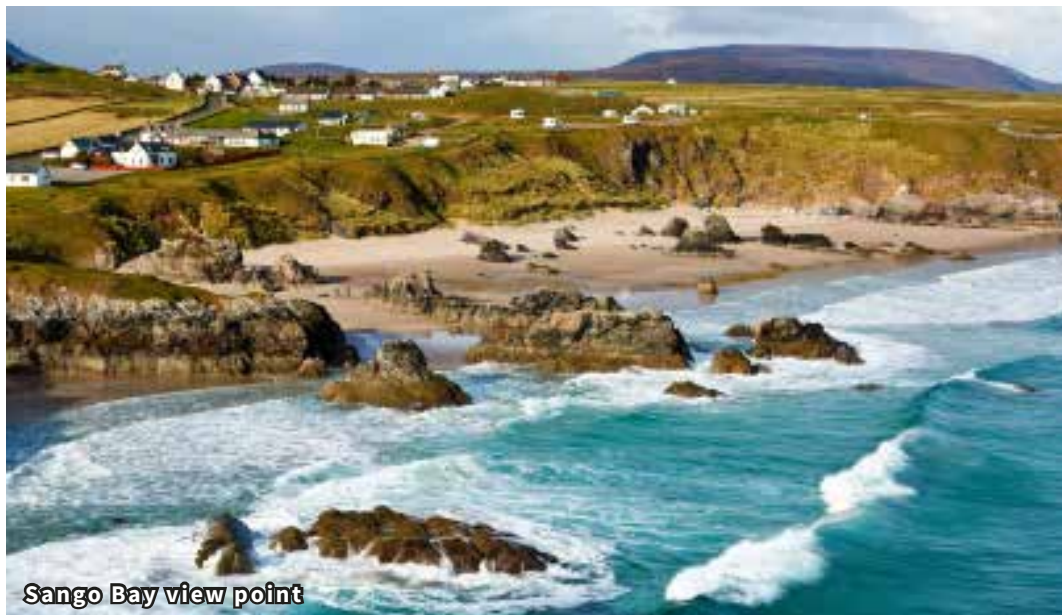
Sango Bay view point