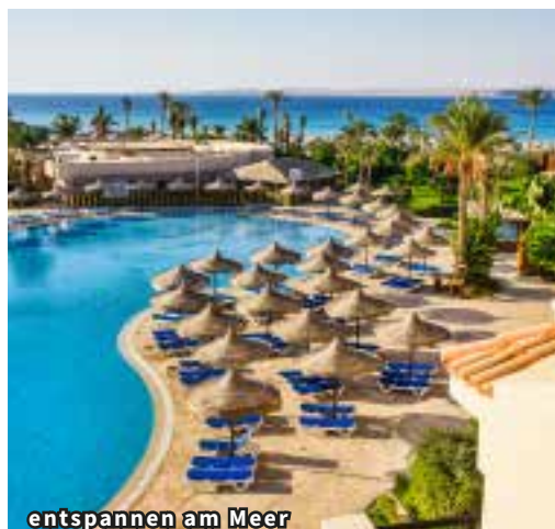
entspannen am Meer