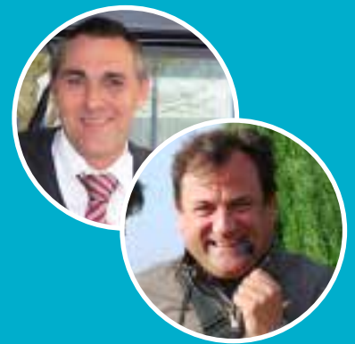
unterwegs mit Franklin & Leo